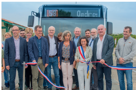
Inauguration de l'arrivée du réseau Txik-Txak à Ondres, le 04 juillet 2022