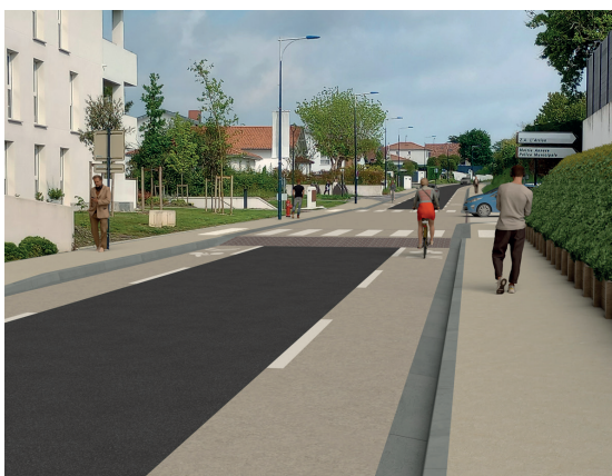
L'aménagement novateur en « chaucidou » de l'avenue du 8 mai 1945 (RD 26)

La qualité de vie et la préservation du cadre urbain constituent un enjeu central pour Ondres. Grâce à une planification rigoureuse, des outils réglementaires adaptés et une stratégie foncière maîtrisée, nous avons agi pour offrir à tous les ondrais un environnement harmonieux, sûr et agréable, où chaque projet d'urbanisme s'inscrit dans une vision à long terme respectueuse de notre identité et de nos espaces.