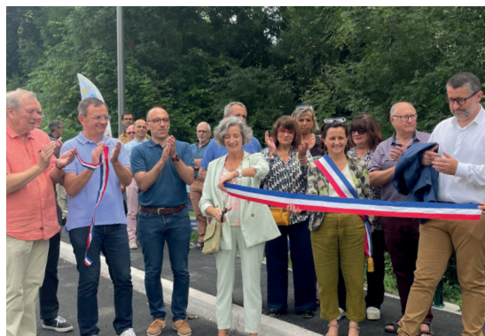
Inauguration du nouveau tronçon Garròs-Mairie d'Ondres sur l'avenue du 11-Novembre 1928 (RD 810), le 11 juillet 2024

Ce faisant, ce sont tous nos quartiers qui seront protégés d'une urbanisation à l'opportunité indésirable et sans plus-value.