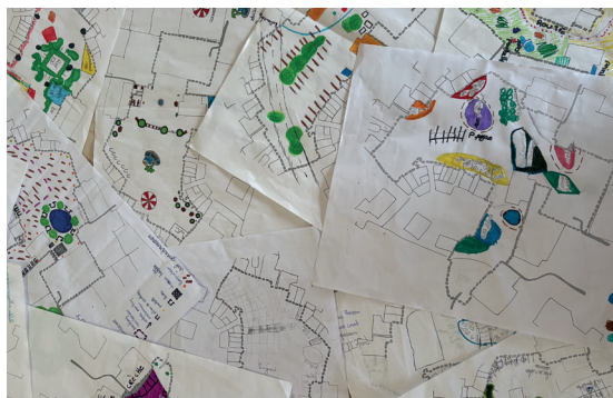
Les enfants des écoles ondraises ont participé activement au dessin du projet de la nouvelle place Richard FEUILLET.

Aujourd'hui, « Ondres 2030 » constitue une véritable feuille de route : un ensemble cohérent de projets structurants, fondé sur les réalisations déjà menées à bien, et qui fixe un cap clair pour le développement futur, dessinant ainsi un nouvel horizon pour la ville de demain.