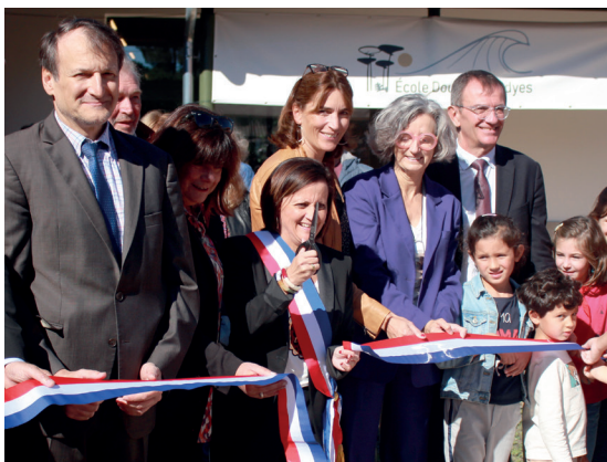
Inauguration du nouveau groupe scolaire Dous Maynadyes, le 3 octobre 2024

L'éducation, l'enfance et la jeunesse sont au cœur de nos priorités municipales, avec une ambition claire : accompagner chaque jeune Ondrais à chaque étape de son parcours de vie. En investissant durablement dans des services publics de qualité et des équipements adaptés, nous avons agi pour offrir à tous des conditions d'épanouissement, d'apprentissage et d'émancipation à la hauteur des enjeux de demain.