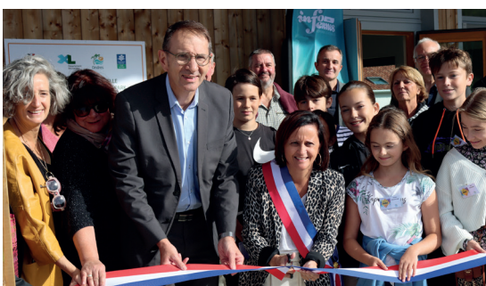
Inauguration de la nouvelle Maison des Jeunes, le « SPOT », le 21 octobre 2023

Tous ces équipements, attractifs et bien identifiés, génèrent des recettes supplémentaires tout en contribuant au dynamisme local, dont profite aujourd'hui chaque habitant.■